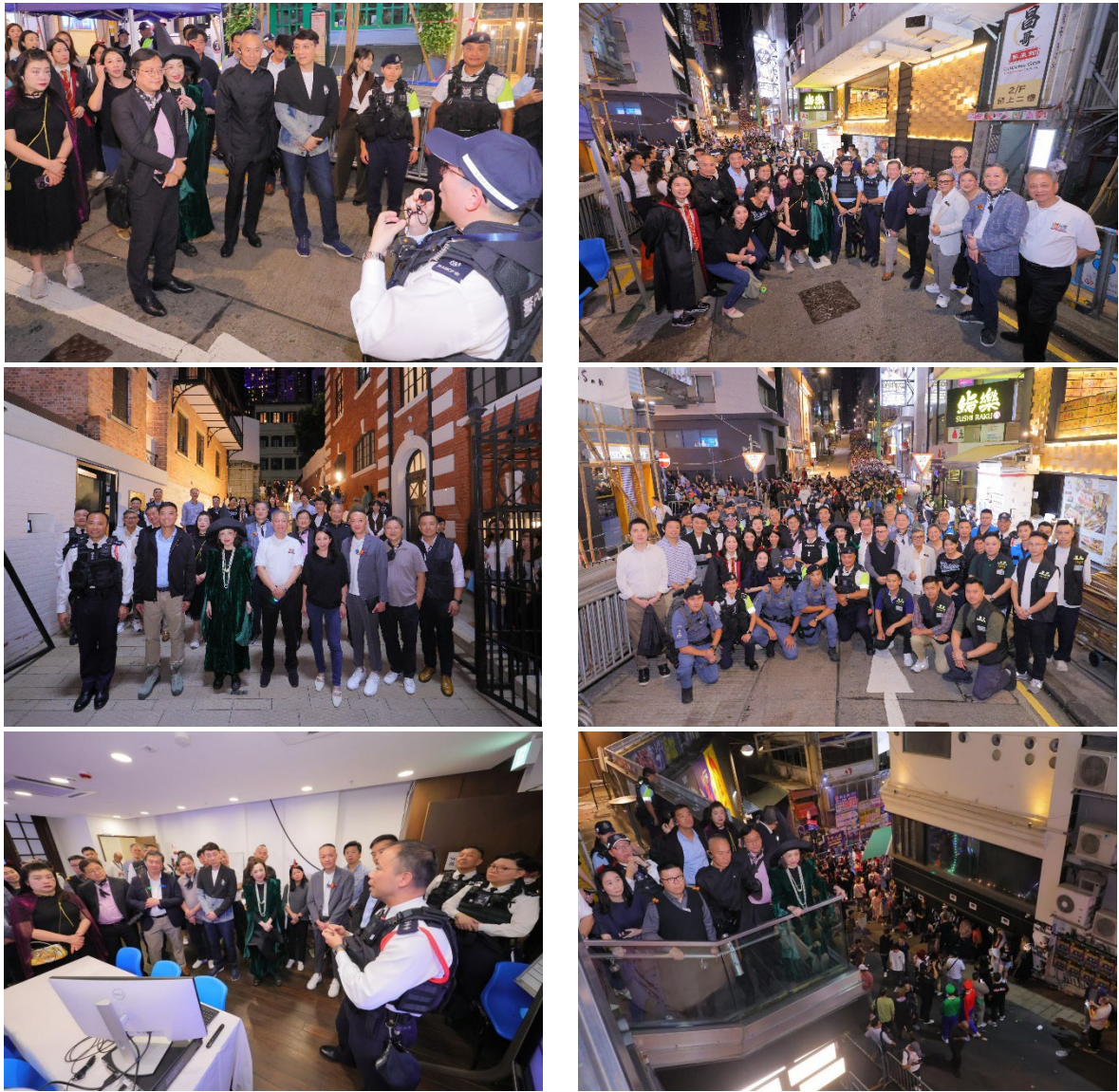
監警會主席王沛詩女士與一眾委員 在監管處處長呂錦豪先生等警方代表陪同下， 在萬聖節當晚於蘭桂坊一帶了解警方的人群管理行動策略。